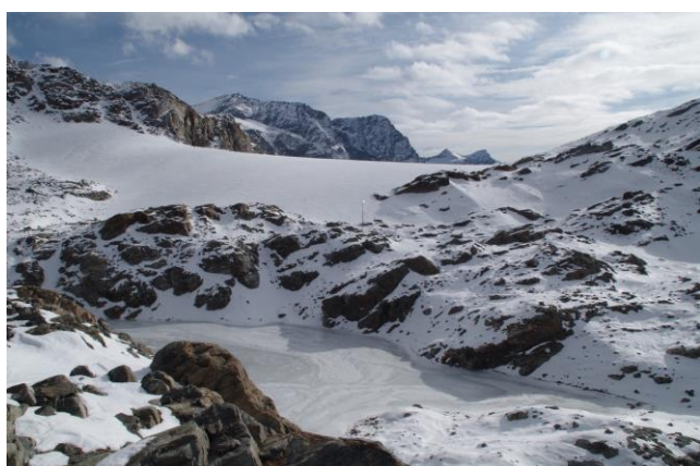
23 settembre 2017