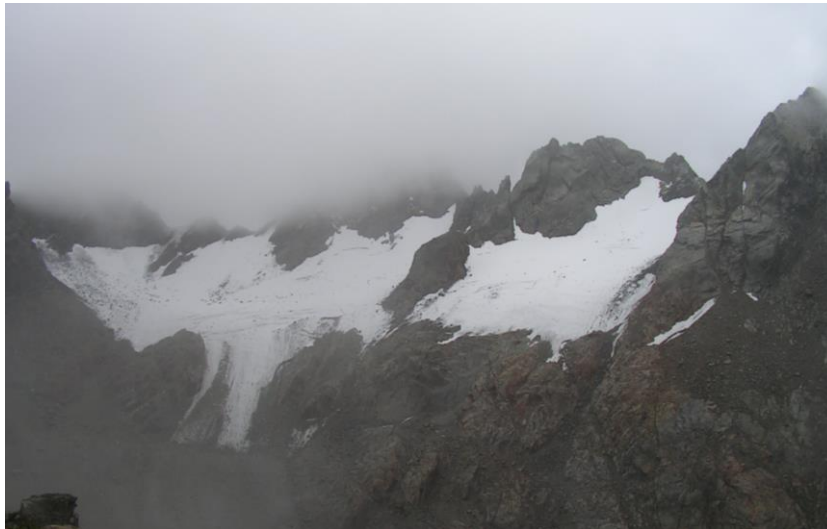
18 settembre 2016