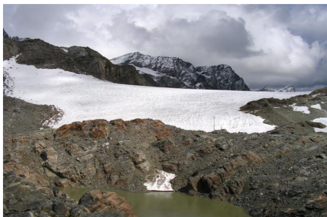
19 settembre 2015