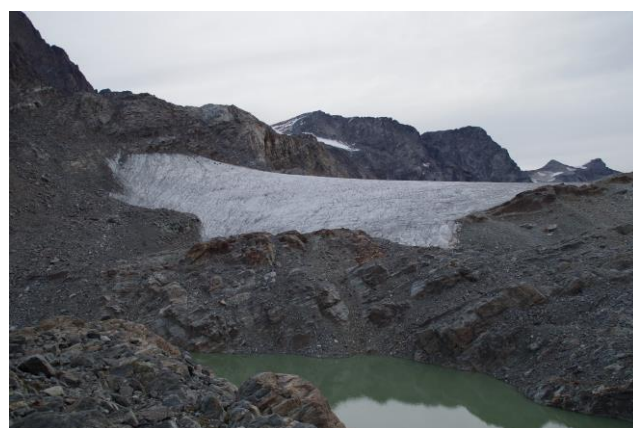
22 settembre 2018