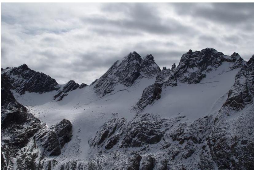
23 settembre 2017