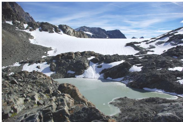
14 settembre 2013

Il Ghiacciaio Marinelli ripreso dalla q. 3073 m : in primo piano il lago proglaciale, al centro l'asta del nivometro della Stazione Meteorologica di Passo Marinelli Orientale (3050 m, ARPA Lombardia) (Galluccio, Zambenedetti).