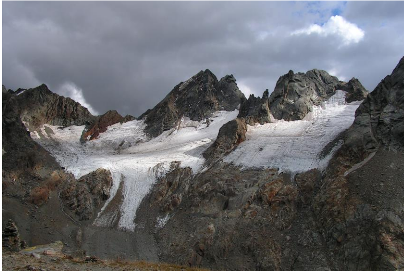
19 Settembre 2015

Ghiacciaio di Caspoggio (dal Rif. Marinelli) al termine delle estati 2015, 2016, 2017 e 2018 (M. Zambenedetti).