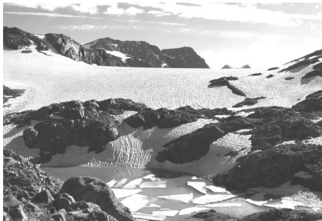
7 settembre 2014