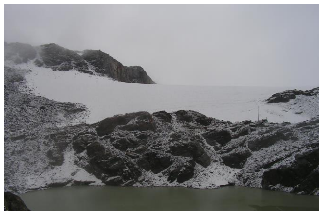
18 settembre 2016